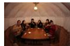
かまくらカフェ (イメージ)