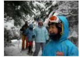
スノーシュー (イメージ)