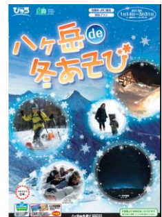
パンフレット(イメージ)