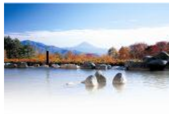
B 賞（イメージ） 提供：ご利用対象の各施設