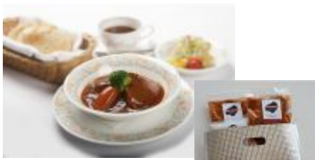
A 賞（イメージ）