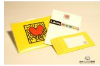
C 賞（イメージ）