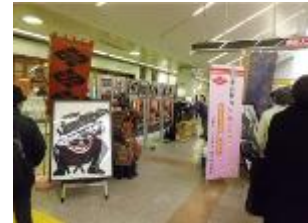
観光PRイベント（イメージ）