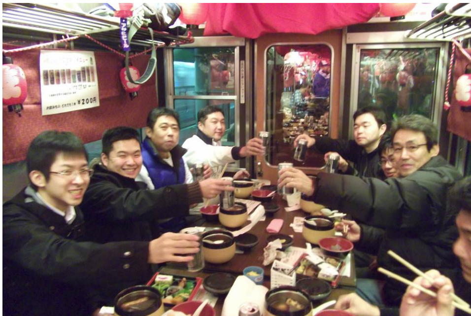
「おでんd e 電車」車内のようす（昨年）