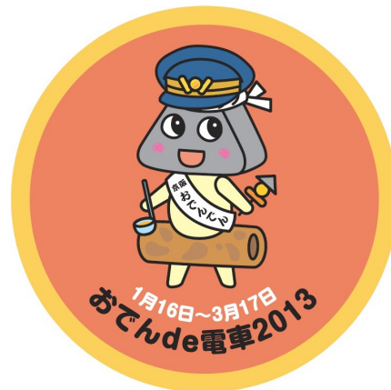
▲掲出ヘッドマークイメージ