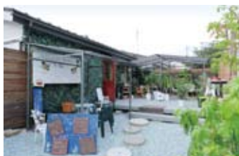
葉に覆われた外壁と赤い扉が印象的。夏風が心地よいテラス席もある

カフェ こもれび 仙台市太白区長町7-12-4 DIOS長町南1F ☎080-3149-9177