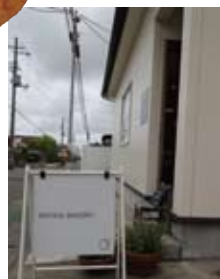
こちらまりとした人気ベーカリー。早朝から営業しているのもうれし!