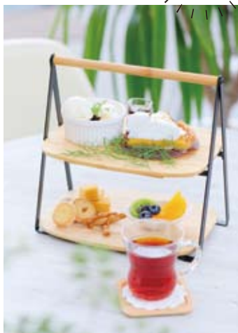
ケーキや焼菓子が約4種類並ぶ「シロクロ午後のお茶セット」(1,250円※水〜土曜のみ提供)