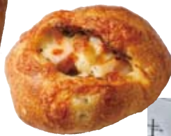
「スパイシーベーコン」(260円・写真右)と「塩生キャラメルのパケットサンド」(220円・写真左)