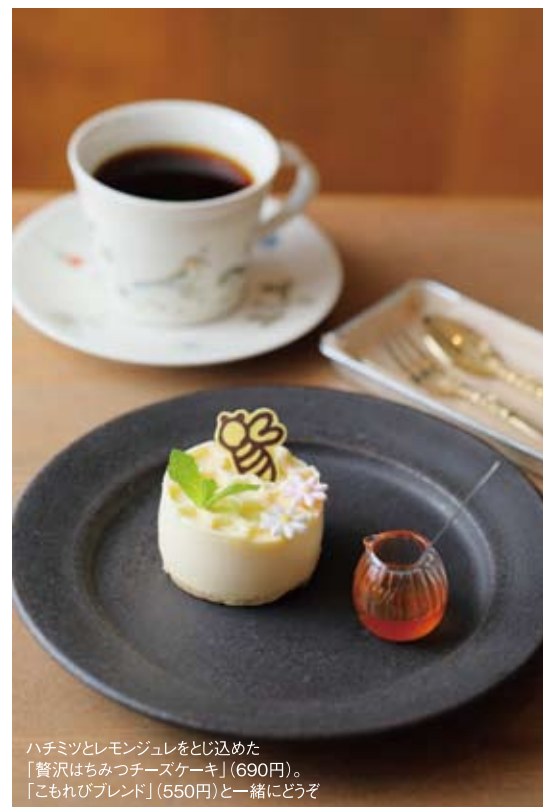
ハチミツとレモンジュレをどじり入れた「贅沢はちみつチーズケーキ」(690円)。「こもれびブレンド」(550円)と一緒にどうぞ

地下鉄長町駅近くの「PUBLIC.COFFEE&BAR」によく行きます。食べ応えのある「ベーコンとソーセージのフレンチトースト」がお気に入り！