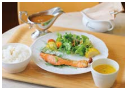
「シロクロ定食」(1,450円)は、肉・魚から選べるメイン料理に、月替りのカレー、スープなどが付いた盛りだくさんなセット