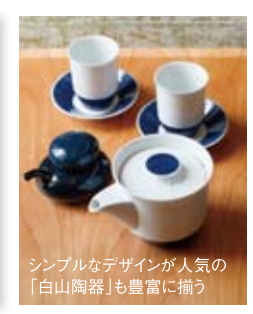
シンプルなデザインが人気の「白山陶器」も豊富に揃う