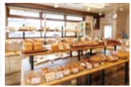
店内には約50種類ものパンが並び