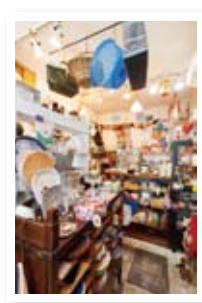
店主が選んだこだわりのアイテムが並び店内。文房具やおもちゃなども販売している