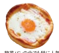
惣菜パンの中でも特に人気の「ベーコンエッグ」(170円)