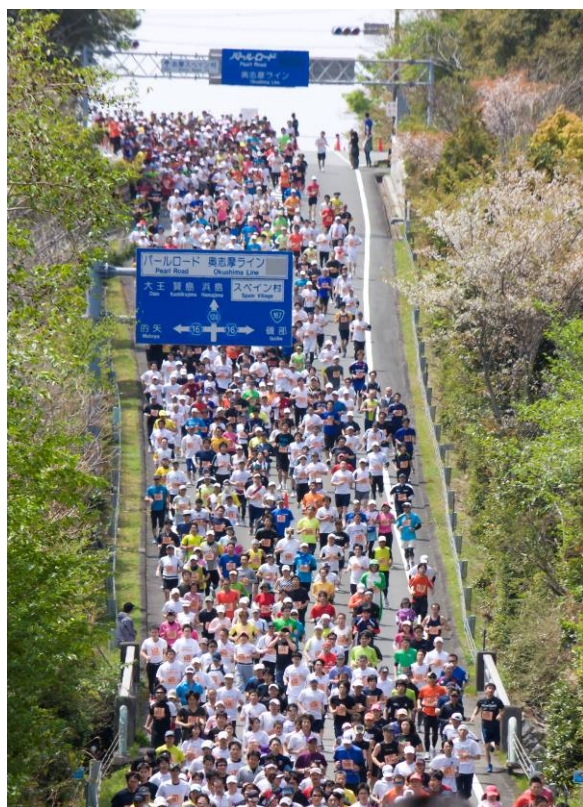
「志摩ロードパーティ ハーフマラソン2011」走行コースの一部

また、本大会のご参加に便利な全席指定、ゼリー飲料とお茶付きの専用列車ツアーを大阪および名古屋方面から実施します。近鉄では、さらに多くの皆様に、大会参加を通じて志摩の景観や美食に触れていただき、再度訪れたい観光地として、伊勢志摩の魅力を再認識していただければと考えています。