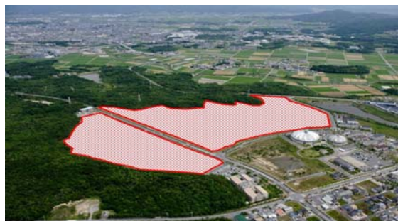
「ゆめが丘住宅地」 メガソーラー発電所建設地

近鉄は、メガソーラー発電所の建設を通じて、三重県と連携を図りながら、再生可能エネルギーの普及促進に貢献するとともに、地域社会への貢献とその活性化に寄与することを目指してまいります。