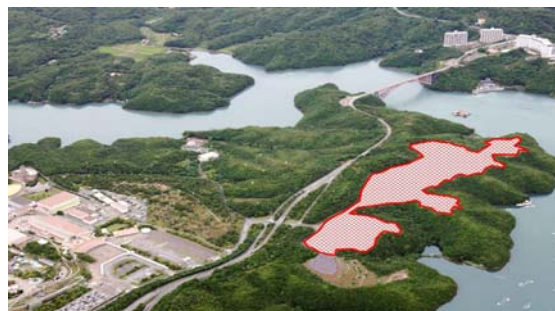
「志摩スペイン村」 メガソーラー発電所建設地