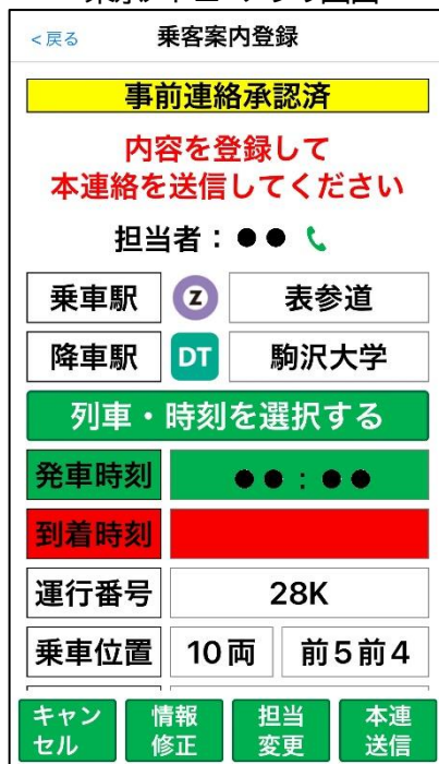
<東京メトロ アプリ画面>