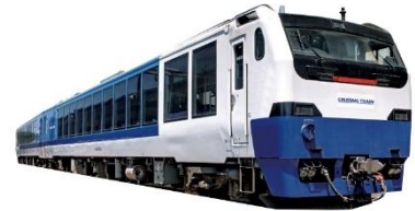
クルージングトレイン イメージ