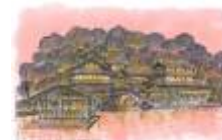
「御座之湯」 2013年4月下旬オープン予定

草津町は、自然湧出量毎分32,300リットルと日本一の湧出量を誇る草津温泉で知られる温泉地です。シンボルである湯畑周辺は、2015年までに大規模な周辺整備を行います。今回は、草津温泉名産の花豆や上州名物、焼まんじゅうの甘辛味噌ダレ、胡桃を使用した草津温泉限定のベーグル、ラスクをご用意しています。