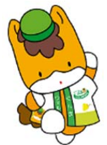
ぐんま県のマスコット 「ぐんまちゃん」

※「地域再発見アプリ」はiPhone、Androidに対応しています。 ※オリジナルグッズは数に限りがあります。