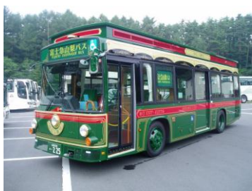
ふじっ湖号(イメージ)