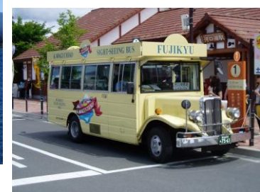
レトロバス(イメージ)