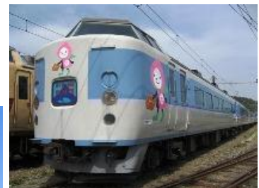
ホリデー快速河口湖号(イメージ)