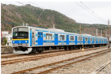
富士急行線(イメージ)