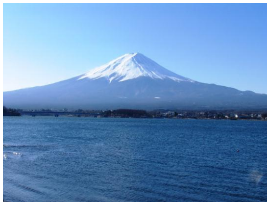
河口湖と富士山(イメージ)