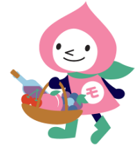
JR 東日本の山梨キャラクター 「モモずきん」(イメージ)