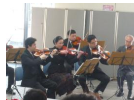
昨年の演奏の様子

JR東日本交響楽団は、JR東日本グループの社員、役員、OBとその家族等により平成3年に結成されたオーケストラです。以来、約70名のメンバーは仕事の合間に練習に励み、現在では年1回の定期演奏会のほか、会社関連行事などでの演奏活動を行っています。今回も昨年に引き続き、このイベントのために特別に弦楽器メンバー15名による合奏団を編成しました。私も当日は合奏メンバーの一人として演奏いたします。