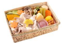
「甲斐の国 よっちゃばれ弁当 ～フジザクラポークと 秋の彩り～」(イメージ)