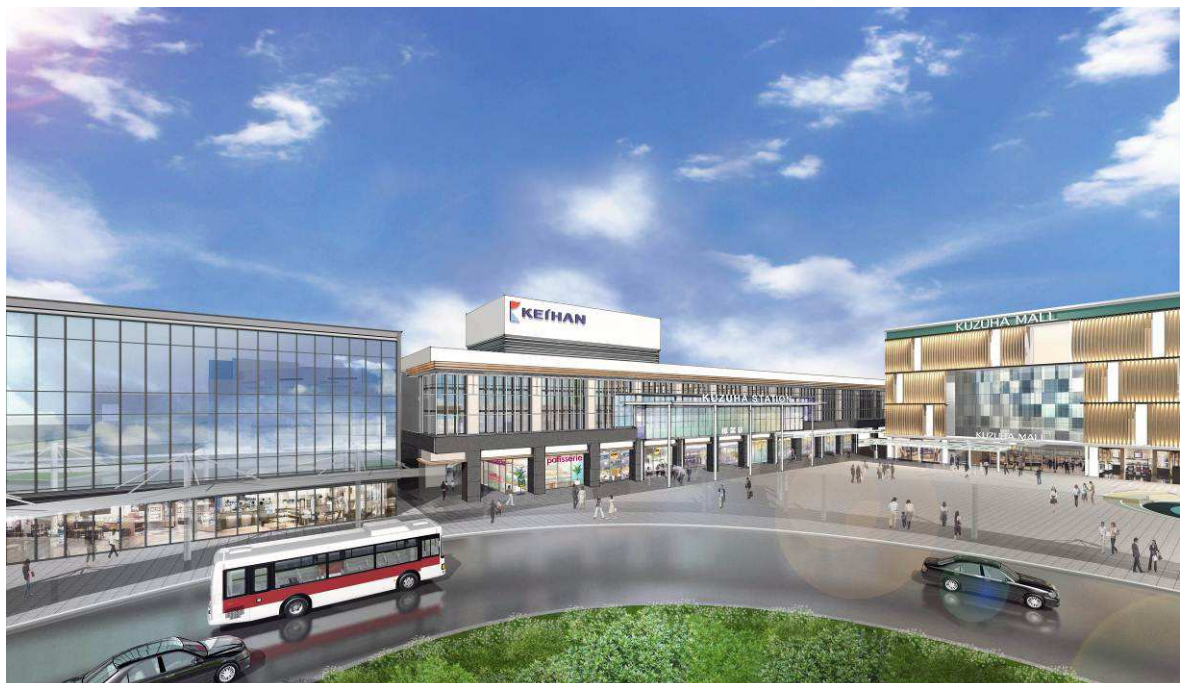
くずは駅前リニューアルイメージ