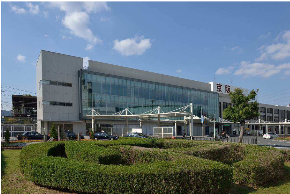
新たにオープンした「京阪くずは駅ビル南館」（左手前）と 来春よりリニューアルに着手する「京阪くずは駅ビル」（右奥）