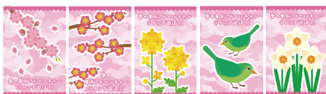
【春編成図柄(20種類)】しだれ桜、紅梅、菜の花、うぐいす、水仙