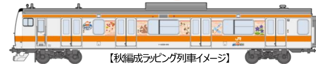
【秋編成ラッピング列車イメージ】