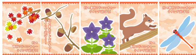
【秋編成図柄(20種類)】リス、紅葉、どんぐり、トンボ、りんどう