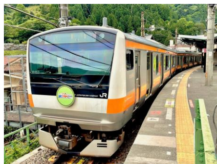
【現行】東京アドベンチャーラインラッピング列車