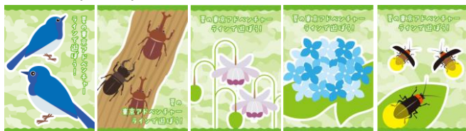
【夏編成図柄(20種類)】オオルリ、カトムシ&クワガタ、レンゲショウマ、紫陽花、蛍