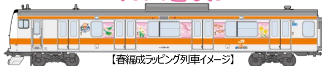
【春編成ラッピング列車イメージ】