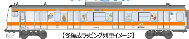
【冬編成ラッピング列車イメージ】