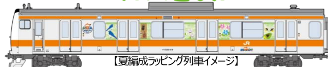
【夏編成ラッピング列車イメージ】