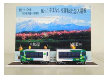
出来上がりイメージ