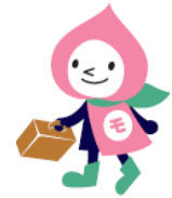
JRの山梨キャラクター 「モモずきん」