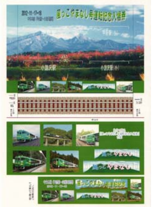
入場券台紙イメージ