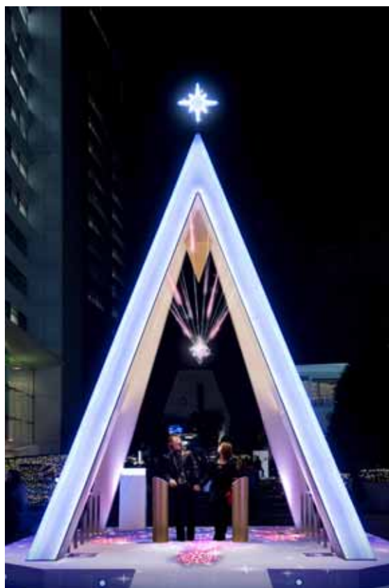
新宿サザンテラス 『流れ星のツリー』