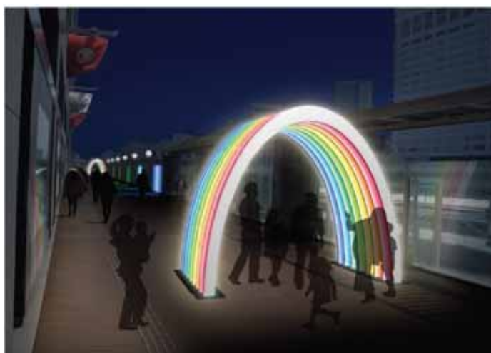
タカシマヤ タイムズスクエア 『レインボーイルミネーション』