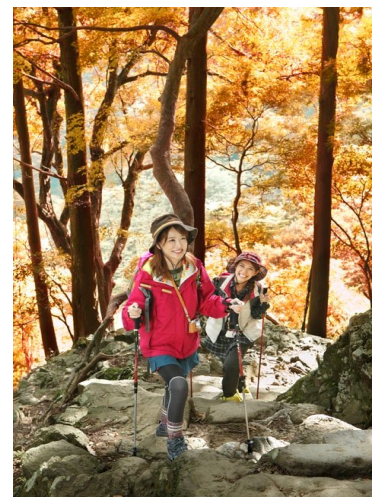
大山登山の様子(イメージ)