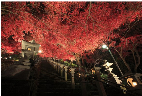
大山寺ライトアップ