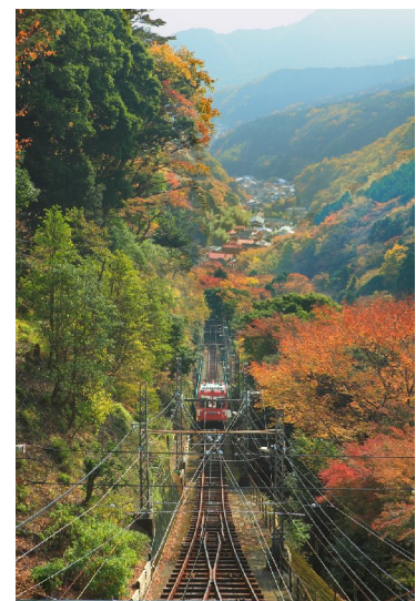
秋の紅葉が美しい「大山」地区の様子