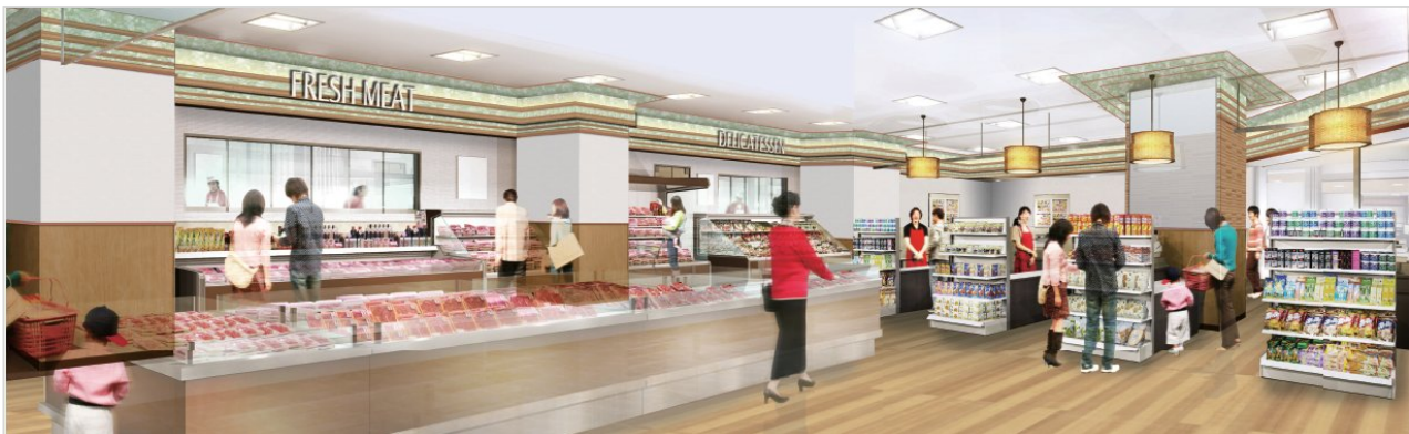
「ViNA ONE FoodS」店内イメージ