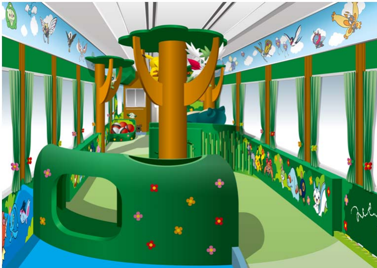
こどもたちがのびのびと遊べる空間： プレイルーム車両