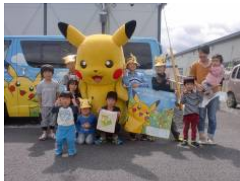
POKÉMON with YOU ワゴンイベントの様子 (宮城県東松島市)

©2012 Pokémon. ©1995-2012 Nintendo/Creatures Inc./GAME FREAK inc.