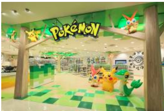
ポケモンセントウトウホク (宮城県仙台市)