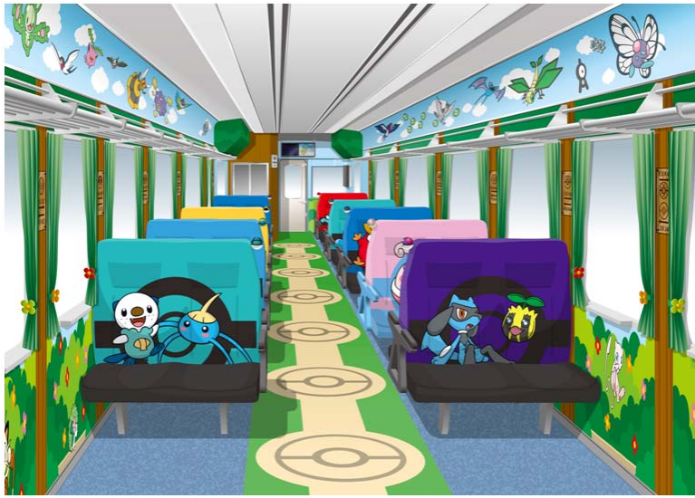
家族で旅を楽しめる空間： コミュニケーションシート車両 (定員 46 名)