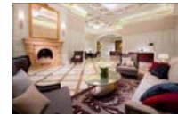
東京ステーションホテル (イメージ)