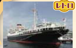
写真上:竣工時の氷川丸 写真下:横浜港に係留されている氷川丸