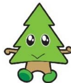
秋田県マスコット スギッチ