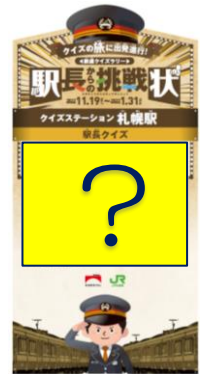
【「駅長クイズ」パネル】 (イメージ)

パネルにはクイズのほかに、所在地の人口や特産品等のまちの情報や鉄道の歴史等を紹介しています。