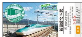
【新函館北斗駅】(イメージ)