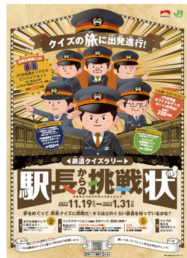
【ポスター】(イメージ)