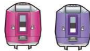
【「ピンバッジセット」】(イメージ)

②【全問正解の方の中から抽選で 30 名様】 「JR 北海道オリジナルピンバッジセット」をプレゼント