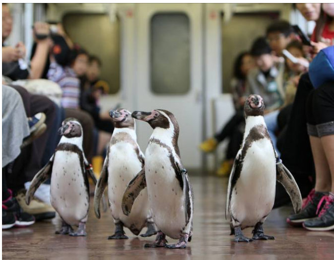
ペンギン列車（前回ツアーの車内の様子）