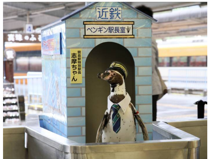
志摩市観光特使・賢島駅特別駅長「志摩ちゃん」