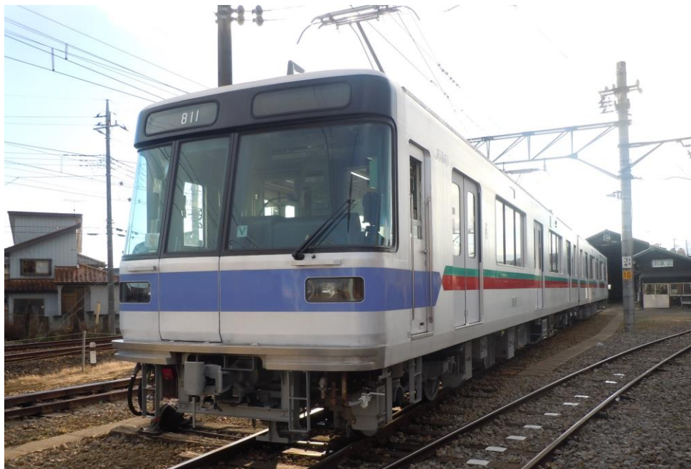
新型車両 800 形