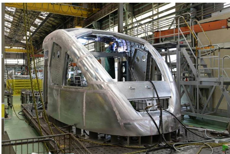
△スペース X（製作過程の様子）