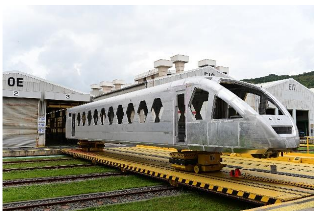
△組み上がった構体