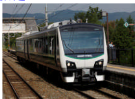
リゾートビューふるさと(イメージ)

「ゆとりとおもてなしのリゾートトレイン」。広々ゆったりとした座席からは、大きな窓越しに善光寺平や北アルプスの雄大な山なみを一望することができます。土・日曜日には車内にて地元の皆さまによる「おもてなしイベント」も開催！ ※イベントは中止となる場合があります。