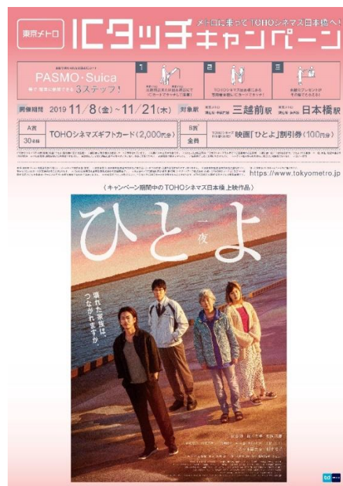
告知ポスターイメージ