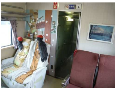
4号車ヌプリシート「クマガラの森」

4号車に設置されていたヌプリシート「クマガラの森」、ラッピングは設置されない車両での運転となるほか、ヘッドマーク、行先表示は「臨時」として運転します。