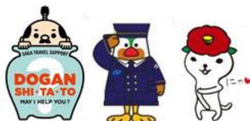
▲左から順に 佐賀県観光PRキャラクター 壺侍 長崎県PRキャラクター がんばくん 長崎県五島市PRキャラクター つばきねこ

佐賀県・長崎県の観光情報が満載のパンフレット等をお配りし、両県のたくさんの魅力をご紹介します。 また、会場の大型スクリーン（O-Vision）では、両県のおすすめ観光地や開業したばかりの西九州新幹線など「新しい西九州旅」をご紹介します。動画を放映します。 さらには、両県のPRキャラクターも気まぐれで登場するかも？