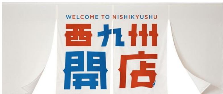
【キャンペーンキャッチコピー】

JR九州とJR西日本では、「博多華丸・大吉」のおふたりをキャンペーンタレントとして、「西九州開店」をキャッチコピーに「新しい西九州の旅」をご紹介しています。“まち歩き”、“食”、“ひと”などをテーマに西九州の魅力を発信しています。また、期間限定の割引きっぷも発売中ですので、ぜひご利用ください。 (2023年3月31日まで開催)