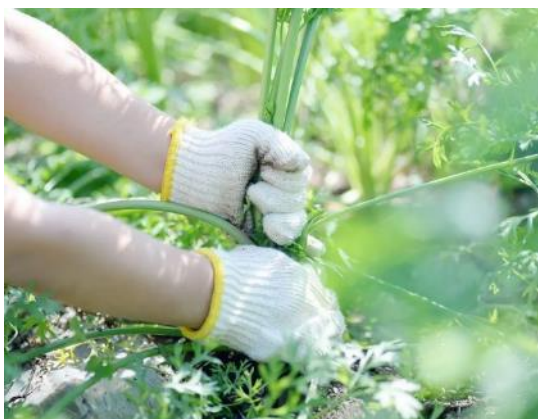
△小川町の農業体験

有機農業で知られる小川町では、旬の野菜の収穫体験ができます。地元の農家の方々とお話を楽しみながら、新鮮でおいしい野菜をいただくと心もお腹も満たされます。