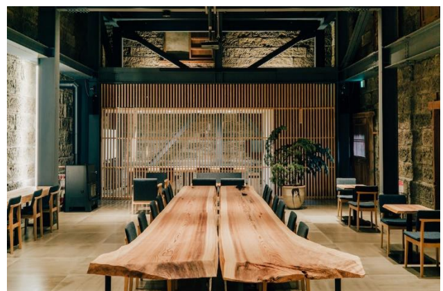
△築100年の石蔵を改装した coworking 施設