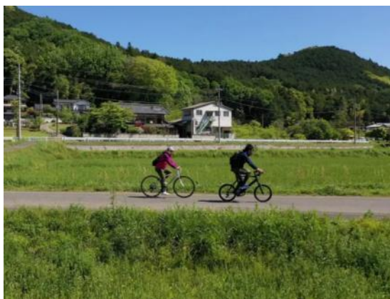
△小川町でサイクリング

小川町では、観光スポット、飲食店などをサイクリングで巡るのがおすすめです。大自然のなかでのサイクリングは、非日常の体験でリフレッシュできます。