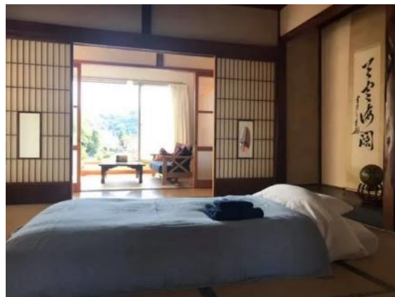
△小川町の民泊施設

一棟貸しの民泊でご家族やご友人とゆっくり過ごすこともできます。キッチンがあるので、小川町の野菜でお料理するのもおすすめです。