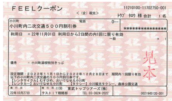
△小川町満喫特別きっぷ（イメージ）