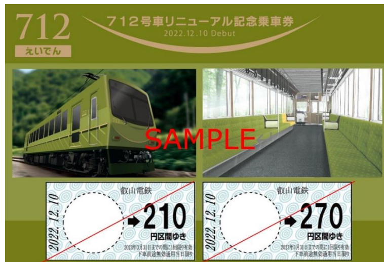
「712号車リニューアル記念乗車券」のイメージ (イラストの部分は写真となる予定です。)

状況によりお1人さまあたりの発売数を制限する場合があります。 なくなり次第、発売を終了します。