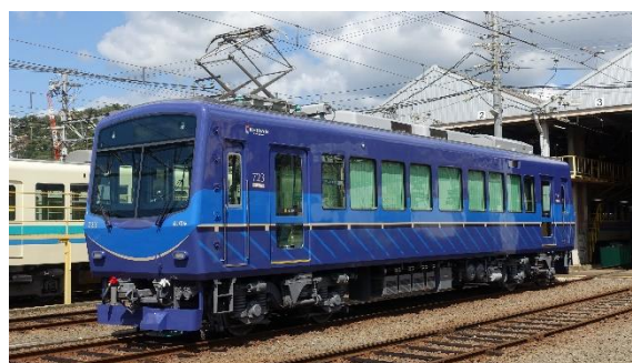
2020年にリニューアルした723号車