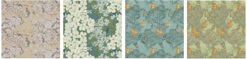
座席仕切りデザインイメージ