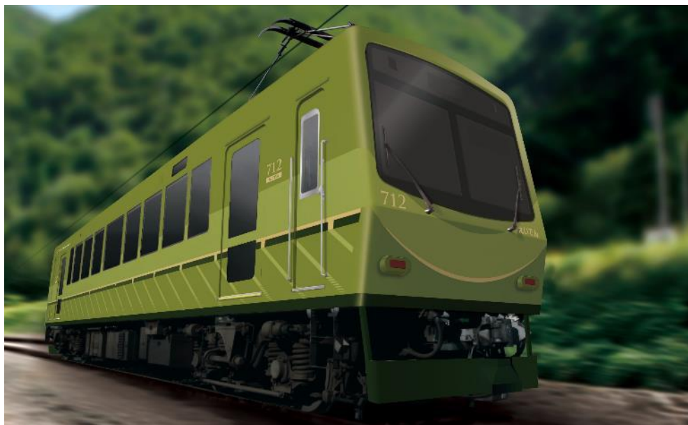
712号車リニューアルのイメージ