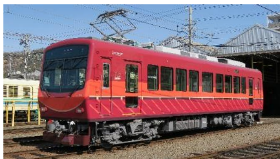
2019年にリニューアルした722号車