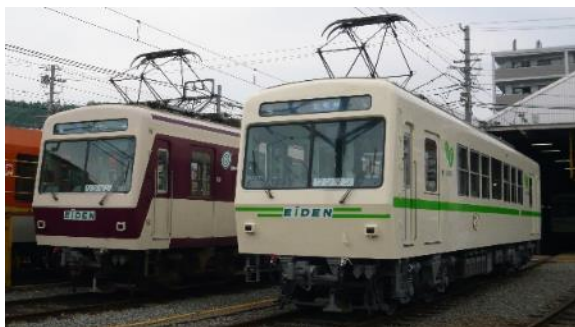
運用開始当時の塗装（左）とデザイン変更後の塗装（右）

運用開始から30年以上が経過したため、732号車は2018年に観光列車「ひえい」へ、722号車は2019年に沿線の神社仏閣をイメージした「朱色」、723号車は2020年に水が豊かな山紫水明の地をイメージした「青色」のカラーリングへリニューアルを行いました。