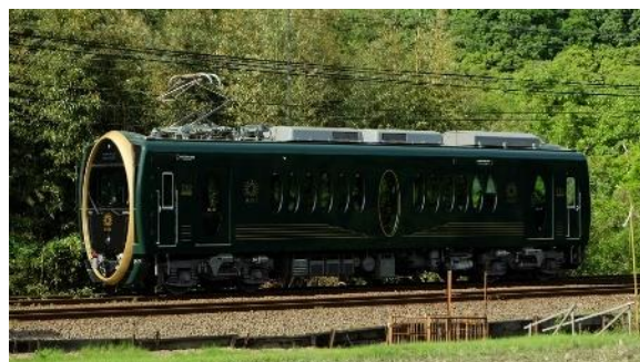
732号車 観光列車「ひえい」