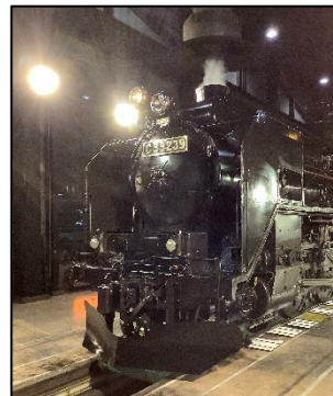
SL 検修庫内の SL(イメージ)