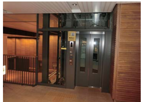
東改札内1階～2階昇降用エレベーター