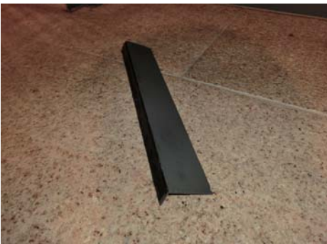
落下したアルミ板