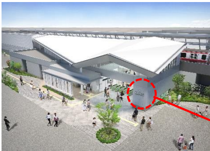
■ JR 幕張豊砂駅(イメージ図)