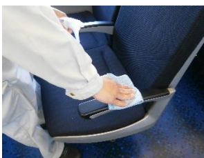
車内の消毒作業 (スカイライナー)