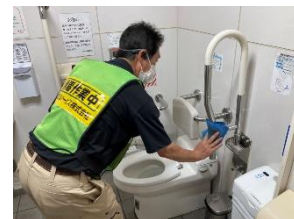
駅構内の消毒作業