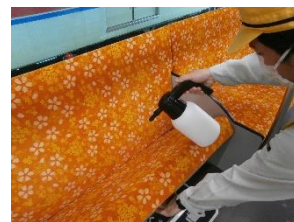
車内の消毒作業 (一般車両)

お客様におかれましても、手洗い・うがい・咳エチケットのほか、時差出勤など混雑時間帯を避けたご乗車や、車内換気のため天候や混雑状況に応じた窓上部の開閉等へのご協力、また、可能な限り、マスクの着用と会話の際の周囲へのご配慮をお願い申し上げます。