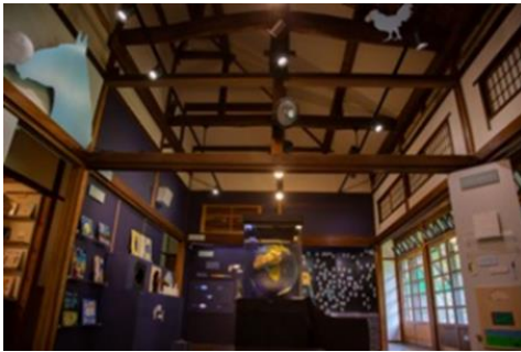
三鷹市星と森と絵本の家

JR武蔵境駅(シェアサイクルレンタル) → 三鷹市星と森と絵本の家 → (野川経由) → 深大寺散策(昼食) → たいやき すえき&山田文具店 → JR武蔵境駅(シェアサイクル返却) → 境南浴場(リーフレット版のみ掲載) → ond craft food+(リーフレット版のみ掲載)