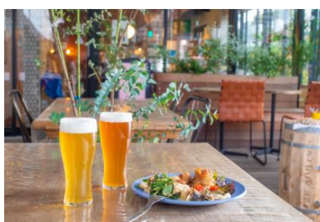
ond craft food+

戦後復興期に創業した初代の意気込みを受け継ぎサウナブームで注目を集める銭湯。一日の疲れを癒しにぜひお立ち寄りください。