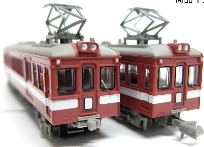
「小田急電鉄デニ1300形・2両セット」