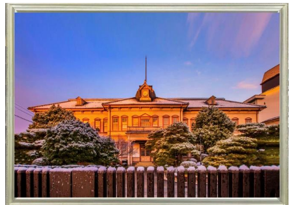
展示作品（一例） 岡山県津山中学校本館（現・岡山県立津山高等学校本館）