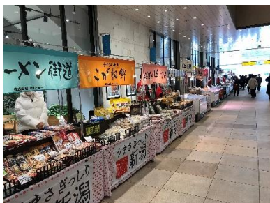
過去の産直市の様子