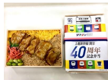
上越新幹線開業40周年記念弁当