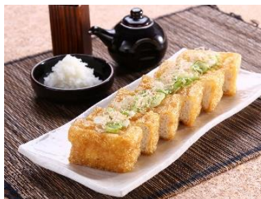
新潟エリアの地産品（一例）