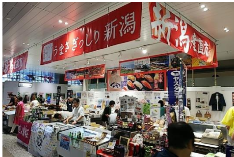
過去の産直市の様子