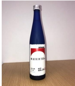
鉄道開業 150 年記念ラベル 「佐渡千年の杉」