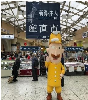
過去の産直市の様子