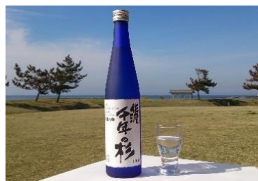
新潟エリアの地産品・地酒（一例）