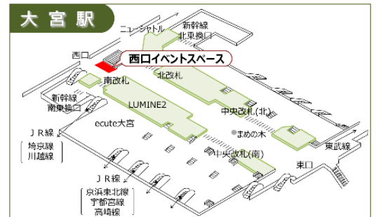
大宮駅産直市会場位置図