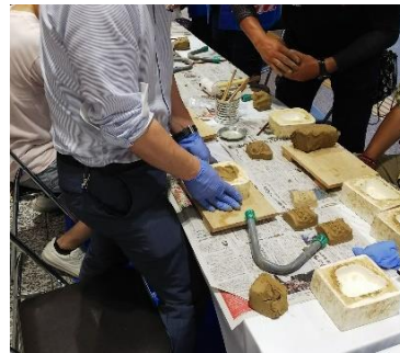
安田瓦粘土遊び体験