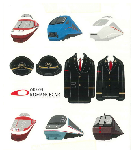
オリジナルロマンスカーシール