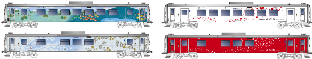
釧網線ラッピング