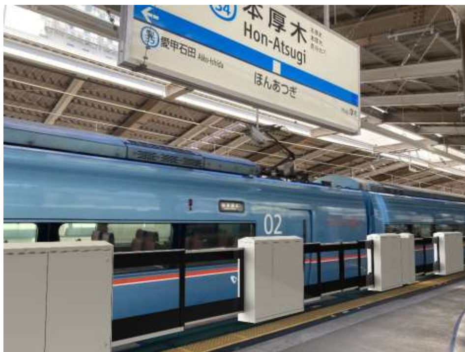
本厚木駅に整備するホームドア（イメージ）

当社では、2032年度までに、小田原線 新宿駅から本厚木駅までの各駅と、江ノ島線 中央林間駅、大和駅、藤沢駅の計37駅へのホームドア整備完了を目指しており、今般本厚木駅に設置するのは、小田急線初の特急ロマンスカーに対応した「大開口ホームドア」となります。開口部分を最大限に広げることで、通勤車両と特急車両の扉位置の違いという課題を解消します。なお、「大開口ホームドア」を用いても、ホームドア戸袋部分が特急ロマンスカーの一部乗降口を支障するため、2022年11月15日（火）始発から、他の乗降口が隣接するEXE・EXEα（30000形）、MSE（60000形）の4号車と7号車の乗降扉の使用を休止します。対象となる駅は、東京メトロ千代田線内を除くすべての特急停車駅で実施します。また、GSE（70000形）は、従前どおり全ての乗降口をご利用いただけます。