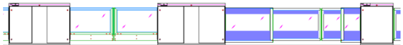
通常開口ホームドア