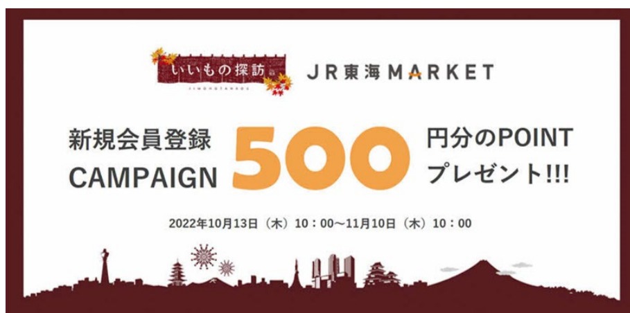
新規会員登録キャンペーンバナーイメージ