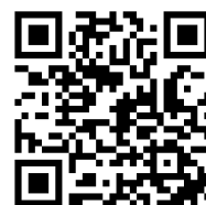
スタンプラリーページサイト

URL : https://e-mono.jr-central.co.jp/shop/e/e6thstamp/