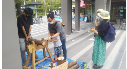
木育イベントイメージ

子どもたちが森林や林業に興味を持ち、身近に感じていただきたいという思いで、今回製作したおちょこの原材料にもなっている小田原の木を使った丸太を輪切りにする体験イベントを開催いたします。ノコギリを使ってヒノキやクスの丸太を切り、木の魅力を体感していただきます。