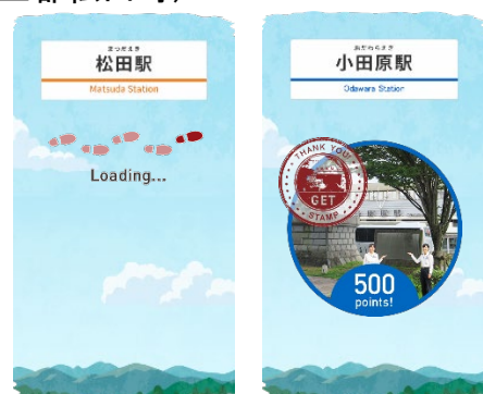
スタンプ獲得画面イメージ