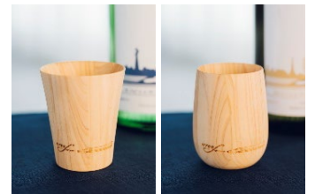
おちょこイメージ

※20歳以上の方には、中沢酒造のお酒を試飲いただけます。ただし、イベント運営の都合上、試飲を中止する場合やご提供をお断りする場合があります。