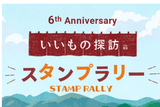
スタンプラリーページイメージ