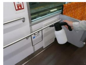
車内の消毒作業 (一般車両)

お客様におかれましても、手洗い・うがい・咳エチケットのほか、時差出勤など混雑時間帯を避けたご乗車や、車内換気のため天候や混雑状況に応じた窓上部の開閉等へのご協力、また、可能な限り、マスクの着用と会話の際の周囲へのご配慮をお願い申し上げます。