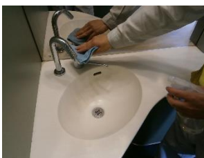
車内の消毒作業 (スカイライナー)