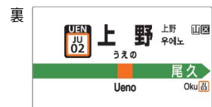
コースター（イメージ）