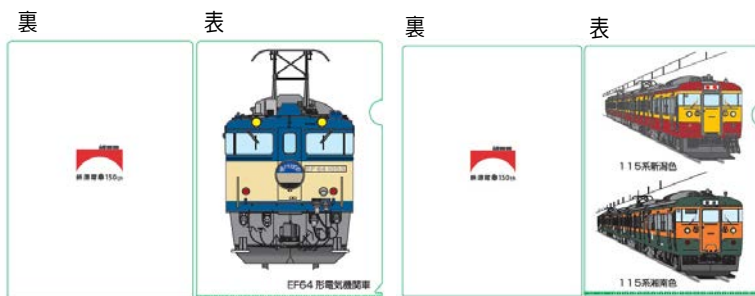
ファイル（イメージ）