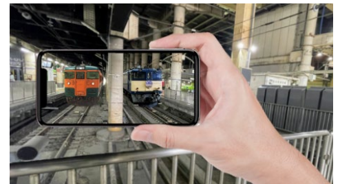
AR 車両フォトスポット（イメージ）