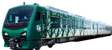
<リゾートしらかみ編成>