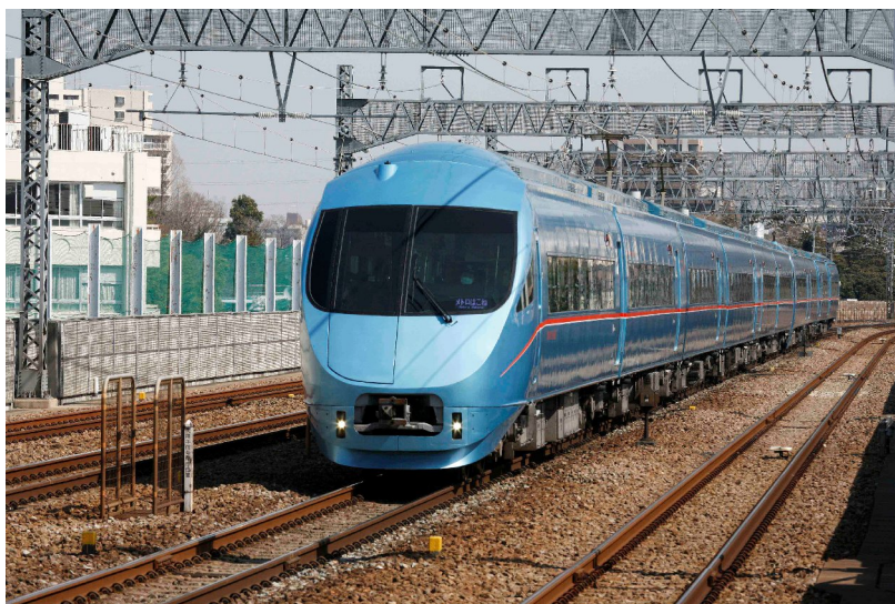
「メトロ湘南マリン号」に使用するMSE