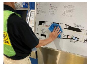
駅構内の消毒作業