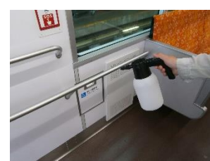
車内の消毒作業 (一般車両)

お客様におかれましても、手洗い・うがい・咳エチケットのほか、時差出勤など混雑時間帯を避けたご乗車や、車内換気のため天候や混雑状況に応じた窓上部の開閉等へのご協力、また、可能な限り、マスクの着用と会話の際の周囲へのご配慮をお願い申し上げます。