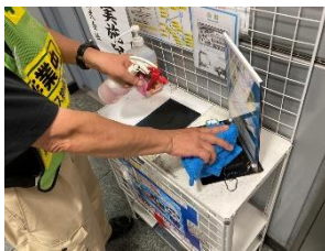
駅構内の消毒作業

※職員の熱中症予防のため、お客様と近接しない事を確認したうえでマスクを着用しない場合がございます。