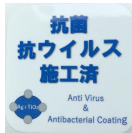
「抗菌・抗ウイルス施工済」ステッカー (鉄道車両内に掲示)