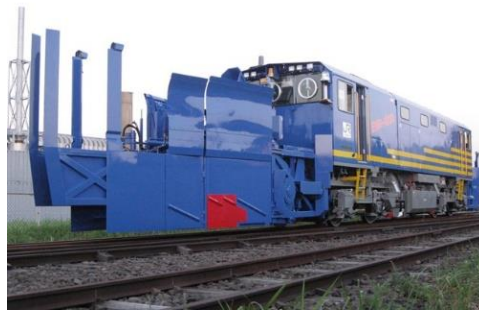
投排雪保守用車（イメージ）