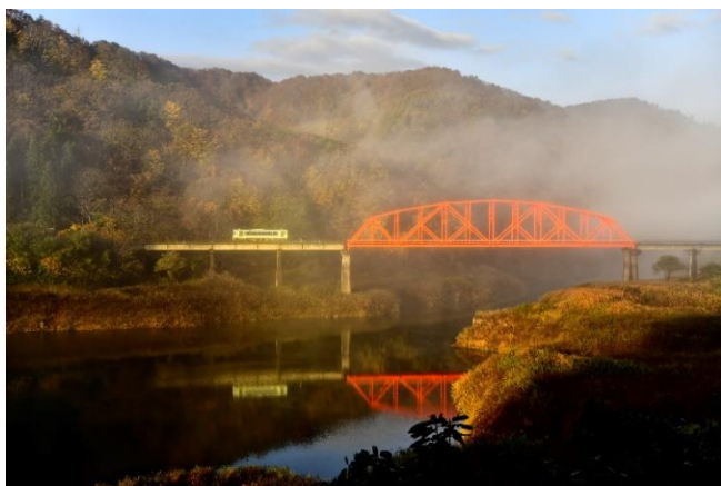
【北上線の秋の風景】

その他にも車窓からは紅葉のいろづき初めを見る事ができ、どこを見ても最高の景色を楽しむことができます。ぜひ秋薫る北上線を感じてください！