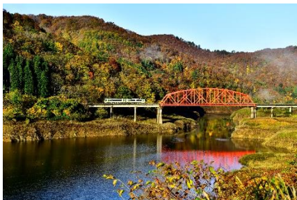
【フォトジェニックな赤橋】