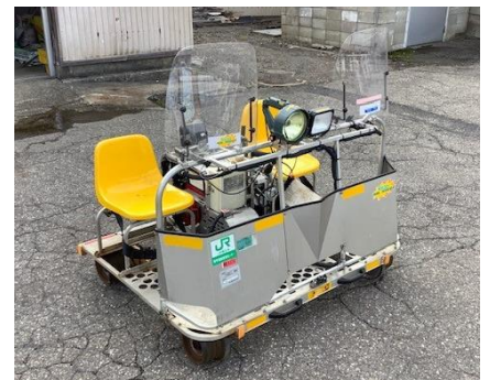
レールスクーター（イメージ）

※天候および新型コロナウイルスの感染拡大状況等により内容を変更する場合がございます。