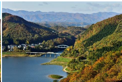
【紅葉のいろづき初め】