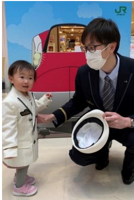
子ども駅長制服着用体験 （イメージ）