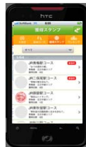
獲得スタンプ表示画面 (イメージ)