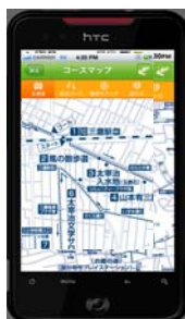
コースマップ画面 (イメージ)

参加者の中の「踏破コース数」と「踏破回数」の2種類のランキングがリアルタイムで表示されます。