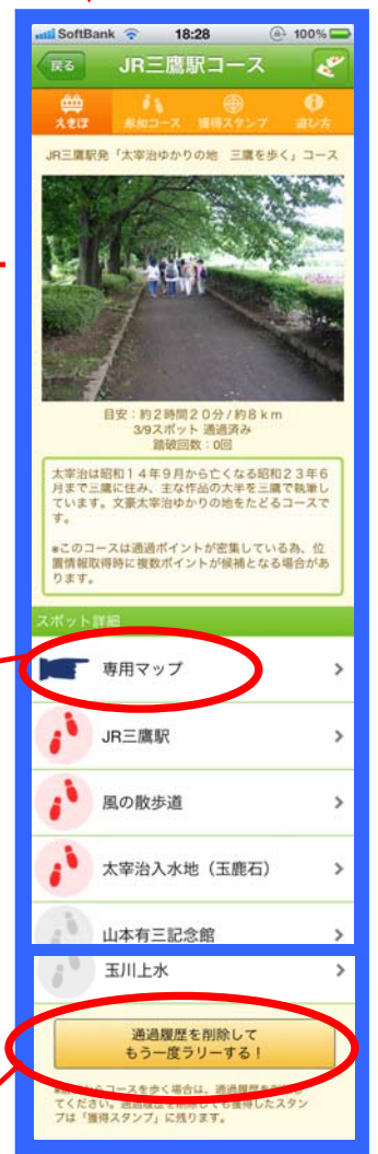
【コース画面】 通過ポイント取得箇所などコース全体が表示されます。