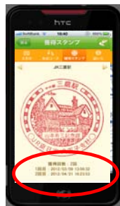
踏破回数表示画面 (イメージ)