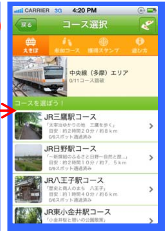
【コース選択画面】 参加したいコースを選びます。