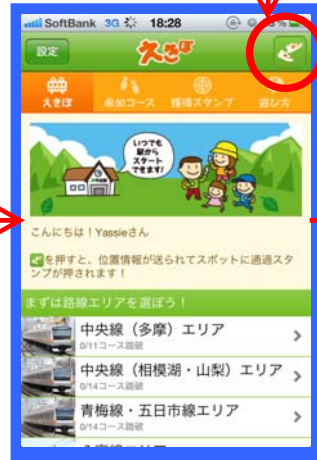
【エリア選択画面】 7つのエリアから参加したいエリアを選びます。