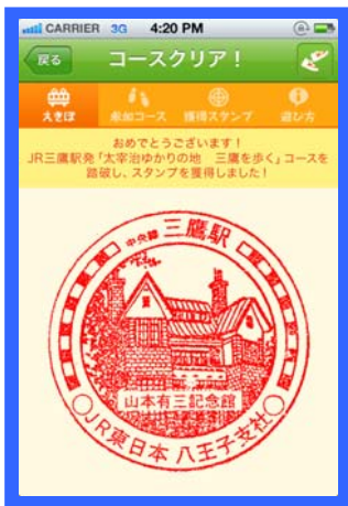
【踏破した際の画面】 コース踏破すると獲得スタンプのページにスタート駅の「駅スタンプ画像」(コースクリアの際に表示)が記録されます。