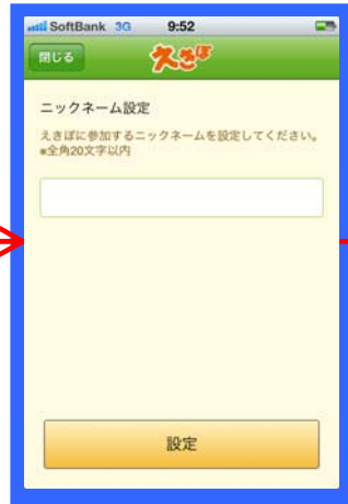
【ニックネーム設定画面】 利用規約に同意するとこの画面になります。ニックネームを設定すると会員登録完了です。