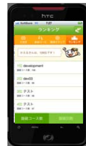
ランキング表示画面 (イメージ)