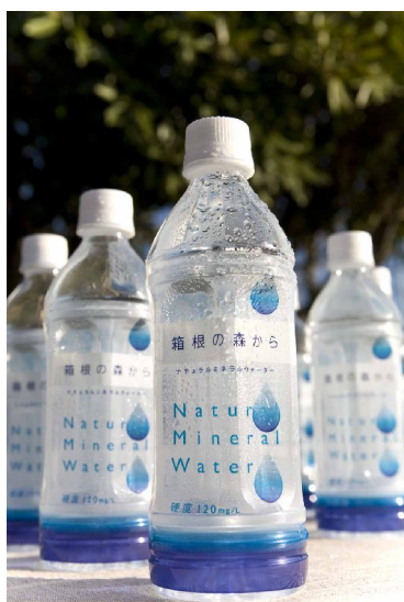
ナチュラルミネラルウォーター 「箱根の森から」

ナチュラルミネラルウォーター「箱根の森から」売上金の一部寄付等の概要は次のとおりです。